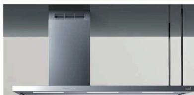
VERSIONE SINISTRA - LEFT SIDE