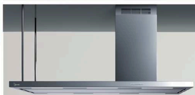
VERSIONE DESTRA - RIGHT SIDE